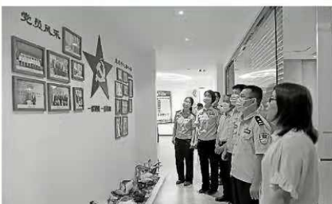
日前, 黄骅市出入境检验检疫局检验检疫综合业务科与黄骅港中远海运物流有限公司党支部开展联合主题党日活动。