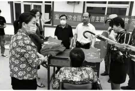
5月17日黄骅三十个贫困村开展“双联双促”活动，黄骅镇工作人员到贫困村开展帮扶工作。