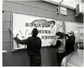
近日，泊头市南郊社区志愿者到生态小区北区，为社区贫困户捐赠物资，并开展健康知识宣讲活动。

本报讯（记者李永刚）日前，泊头市“泊头桑葚”荣获中国地理标志证明商标。这是泊头市继“泊头鸭梨”之后，又一个获得国家地理标志证明商标的农产品。泊头桑葚种植历史悠久，品质优良，口感独特，深受消费者喜爱。